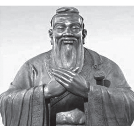
الحكيم القديم كونفوشيوس

كما يلقي الكتاب رواجاً بين أجيال متعددة رغم الاختلاف الكبير بين تجربة تيان التي عاشت حقبة الإصلاح في الثمانينات والتسعينات والجيل الأكبر سناً الذي عاصر فترة حكم ماو تسي تونغ شديدة الاضطراب. واعتنق أبطرة الصين الفلسفة الكونفوشية التي تؤكد على الأخلاق الرفيعة وتسلسل هرمي صارم للعلاقات الاجتماعية على مدى ألفي عام ولا يزال لتعاليم كونفوشيوس تأثير هائل في دول أخرى في جنوب شرق آسيا. وقال تشو داك الأستاذ والناقد الثقافي في جامعة تونجي في شنغهاي "فجأة وجدت دولة اعتادت أن تضع الأخلاق قبل كل شيء نفسها بلا أي معيار أخلاقي، يقود ذلك لحالة من القلق لا مفر منها". ووفقا لنفس المصدر - كتبت تشو "جوهر" المقتطفات الأدبية أن تدلنا كيف نحيا حياة سعيدة وهو ما نتوق له، لا تقتصر أن ترقى لمستواها، ولكنها بكل بساطة تحدد توجهك في الحياة العصرية الحديثة".