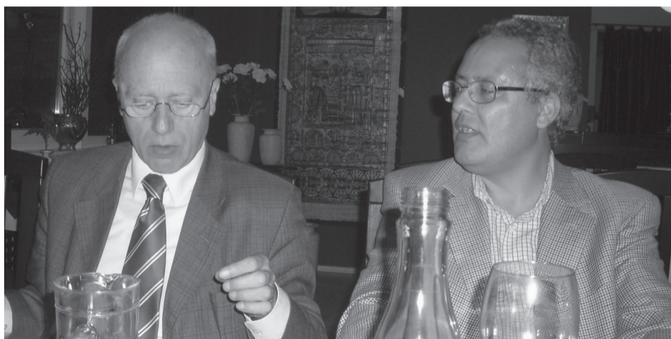
حميد لشهب وهانس كوكلر خلال المحاضرة (خاص)

رجع دون شكليات ودون عقد نفسية و أيديولوجية إلى المسيحية، وبالخصوص إلى جزء منها يدعي امتلاكه للحقيقة المطلقة وممارسة مهامه باسم الله. مثل هذا يلتمس بالمحوظ، يقول كوكلر، في شخصية الرئيس الحالي للولايات المتحدة الأمريكية وفي شخصية البابا الحالي للكاتوليكية المعاصرة، الذي داس كل تقليد البابا المنوفى جون بول الثاني في دعوته للحوار ومد اليد للإسلام والمسلمين. ويرى هذا الفيلسوف الغربي الجريء بأن باب الحوار سوف يبقى موصودة مادام الغرب لا يظهر أية نية حسنة لإنجاح هذا الحوار وما دام في موقع السيطرة يدوس على المبادئ التي يطالب الآخرين بتطبيقها سواء في نظم الحكم كالديمقراطية أو في العلاقات الدولية كالعدل والإحتكام إلى المؤسسات الدولية الشرعية لحل النزاعات بين الشعوب وإرجاح كفة على أخرى حسب مصالحه. فمنطق الغرب القوي والسيطر الكيل بمكاليين فيما يتعلق بالقضايا العربية العادلة كالقضية الفلسطينية والحرب في العراق والنزاع مع إيران، دليل ساطع في نظره على إيمان الغرب بمنطق وحيد هو منطق الهيمنة. والحوار في فلسفة كوكلر هو خطوة لاحقة وغير سابقة قد يأتي بعد خطوة أولية أساسية تتمثل في التعايش والتعايش في عرفه هو كف الغرب على إملاء شروطه وترك الشعوب الأخرى، بما في ذلك الشعوب العربية والإسلامية، عيش اختلافها الثقافي والديني في حضن عالم متعدد. والتخلي عن فكرة "القرية الصغيرة" التي ستمنحني فيها كل الثقافات العالمية لصالح ثقافة وحيدة ليس من الضروري أن تكون صالحة وجيدة للجميع، هي شرط ضروري للتعايش.